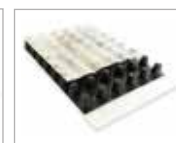
3. ND 220