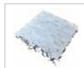
1. Xerodrän VT17

VegTech Sedummatta ca 30 mm ND 5+1 27 mm Vattenhållande stenull 40 mm Grodan TT ND 220 12,5 mm