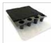
2. ND 5+1