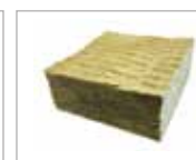
5. Grodan TT